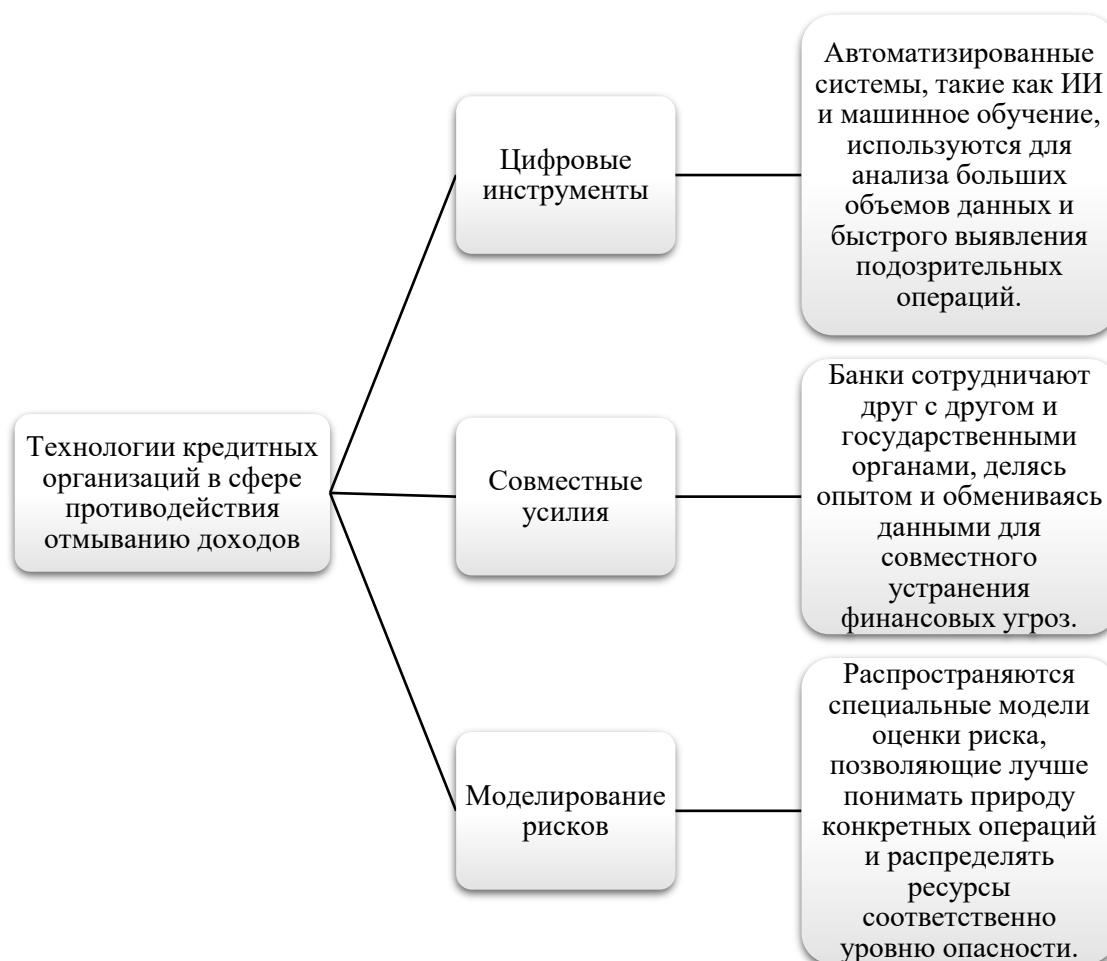
Рисунок 2 – Технологии кредитных организаций в сфере противодействия отмыванию доходов

В последние годы наблюдается переход многих российских банков на использование высоких технологий в сфере противодействия отмыванию доходов (рис. 2).