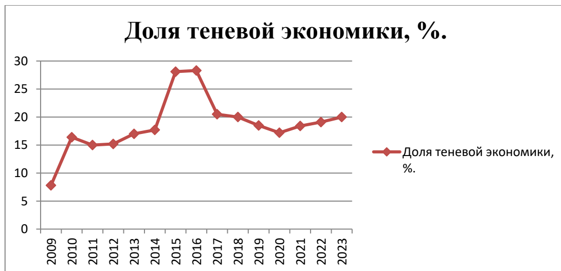
Рисунок 2 – Доля теневой экономики от ВВП, в процентах.

неформальной экономической деятельности, её точное измерение сопряжено со значительными методологическими трудностями. Следовательно, представленные данные следует рассматривать как оценочные, полученные на основе различных косвенных методов и статистических моделей. В этой связи значения могут варьироваться в зависимости от используемых источников и подходов к оценке [11, с. 98].