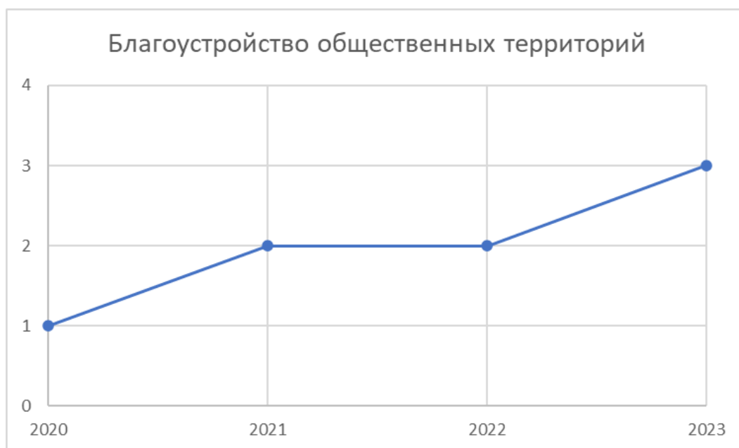
Рисунок 2 – Количество благоустроенных общественных пространств за 2021-2023 годы

Общая площадь Курчатовского района составляет 60,1 квадратных километров. Площадь общественных территорий, нуждающихся в обновлении, составляет 204 146 квадратных метров [9]. Количество благоустроенных общественных территорий за период с 2020 года по 2023 год показано на рисунке 2.