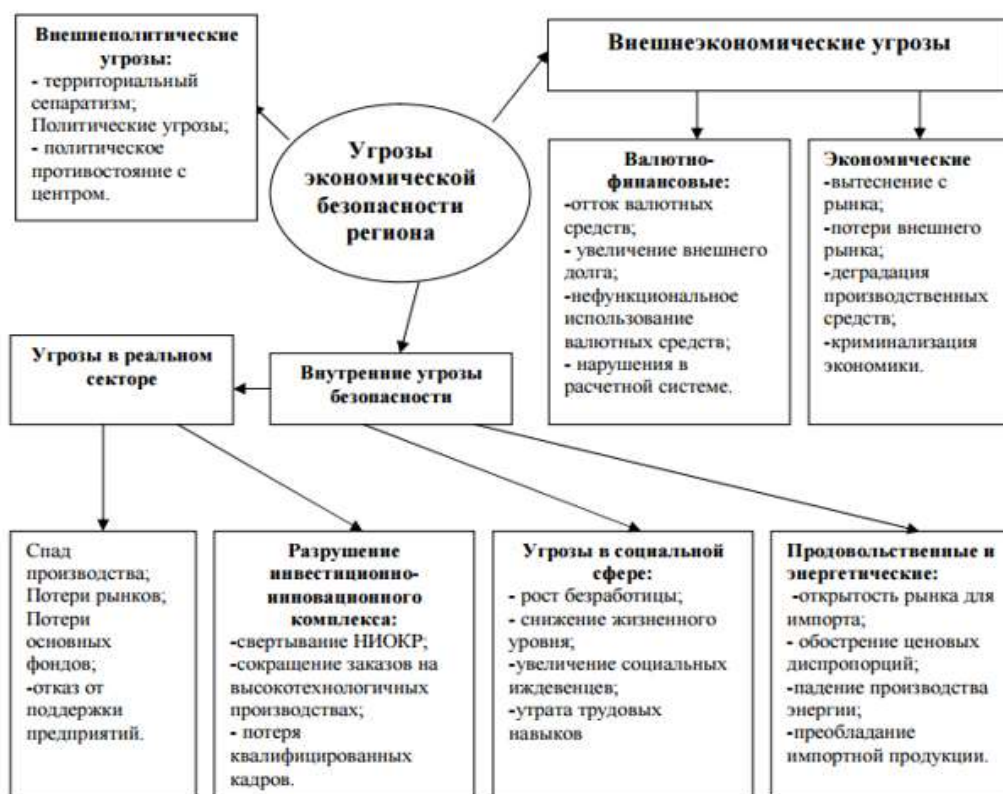
Рисунок 1 – «Угрозы экономической безопасности»

Интересным представляется рассмотреть вопрос криминализации и декриминализации отдельных составов, предусмотренных УК РФ. Многие исследователи полагают, что криминализация отдельных действий (бездействий) в рамках определенной экономической деятельности является излишней, поскольку такие деяния не являются общественно-опасными, не наносят вреда обществу и т.д. Действительно, данная идея во многом отразилась и в уголовном законе: за все время действия УК РФ было декриминализировано четыре состава преступлений в сфере экономики, что, на наш взгляд, является положительной тенденцией развития уголовного законодательства, поскольку признание определенных действий в качестве преступных в рамках осуществления предпринимательской деятельности негативно влияет на развитие и функционирование как хозяйствующих субъектов, так и экономической системы в целом, что, несомненно, сказывается и на экономической безопасности регионов РФ.