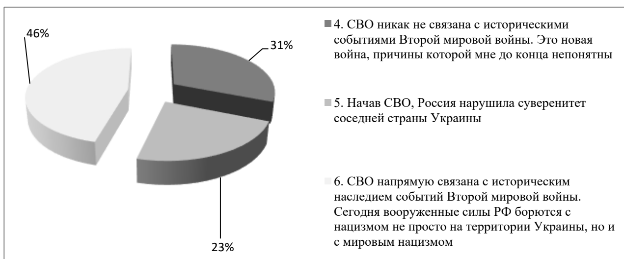
Рисунок 2 – Высказывания, исследующие отношения респондентов к событиям СВО

3.«Мы очень серьезно относимся к данной дате. Нужно всегда помнить о тех, кто ценою своих жизней защитил Родину. Нельзя допускать фальсификации истории, ведь только зная опыт прошлых поколений, мы сможем не допустить таких трагичных событий в будущем» – 56%.