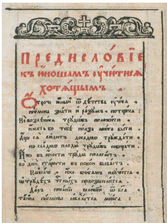
Рисунок 1 – Страница «Букваря языка славенска» Симеона Полоцкого (1679 г.)

В рамках эксперимента с детьми изучались особенности текстов, содержащих элементы эпистолярного стиля речи, из российских учебных книг XVI-XVIII веков. Для того, чтобы исследование прошло эффективно, необходимо структурировано и последовательно организовать выполнение заданий. Анализ текстов целесообразно начать с самого раннего, а завершить самым поздним, для того, чтобы проследить динамику изменения русской речи. Выбор источников исходил из определения того, что можно отнести к учебным книгам (учебной литературе) и текстам эпистолярного жанра. К первым относятся многочисленные учебники, буквари, справочники, лекции и т.д., используемые в образовательных целях [4]. Ко вторым можно отнести тексты, имеющие «форму письма, открытки, телеграммы, [посылаемые] адресату для сообщения определенных сведений» [6]. Нами не было найдено эпистолярных текстов из учебных книг XVII века, однако в «Букваре языка славенска» Симеона Полоцкого (1679 г.) в начале предисловия обнаружили обращение: «Отроче юный» (рис. 1) [3, 6], а обращение перед сообщением какой-то мысли является одним из элементов эпистолярного стиля речи.