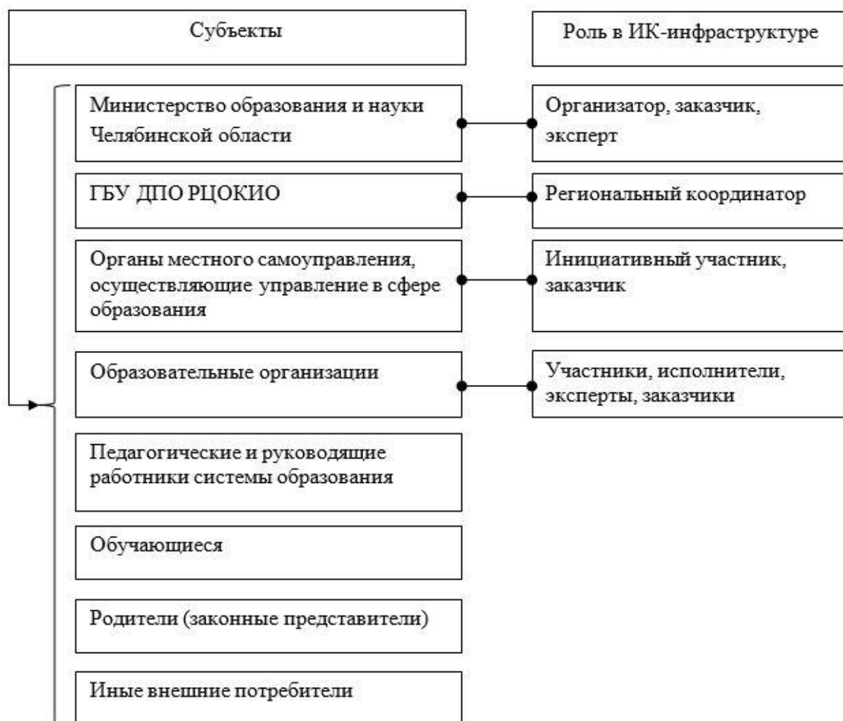
Рисунок 3 – Система субъектов информационной политики в сфере дошкольного образования Челябинской области

субъектами, представленными на рисунке 3.