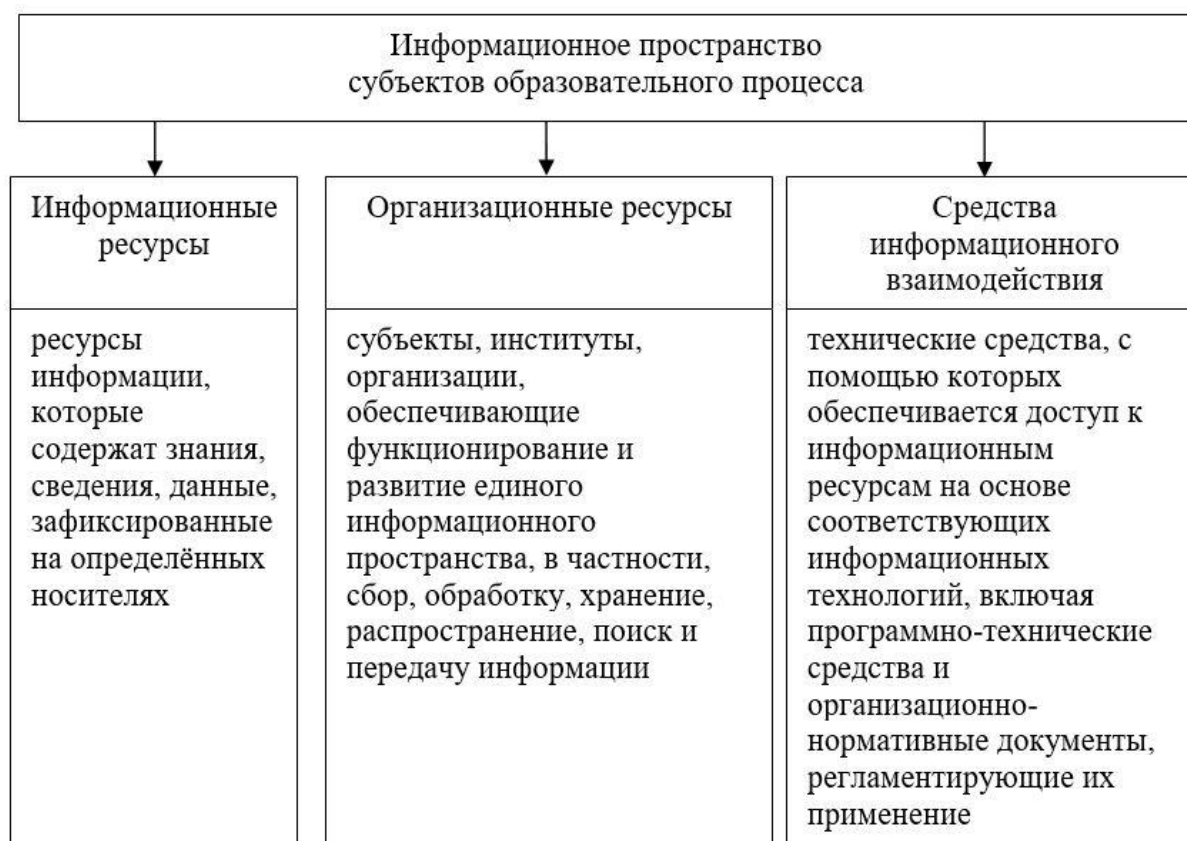
Рисунок 1 – Компоненты единого информационного пространства субъектов образовательного процесса

Во-вторых, информационное пространство рассматривают как исторически сформировавшуюся, обеспеченную правовыми гарантиями и средствами связи, позволяющими обеспечить «...максимальную меру доступности для потребителя форму скоординированных и структурированных, территориально близких и удалённых информационных ресурсов, объединяющих результаты коммуникационной деятельности людей» [9]. Информационное пространство представляет собой один из аспектов социального пространства, которое в коммуникативном аспекте представляет собой пространство распространения информации, или информационную сферу. В рамках указанной выше Концепции выделяются следующие компоненты единого информационного пространства (рис. 1).