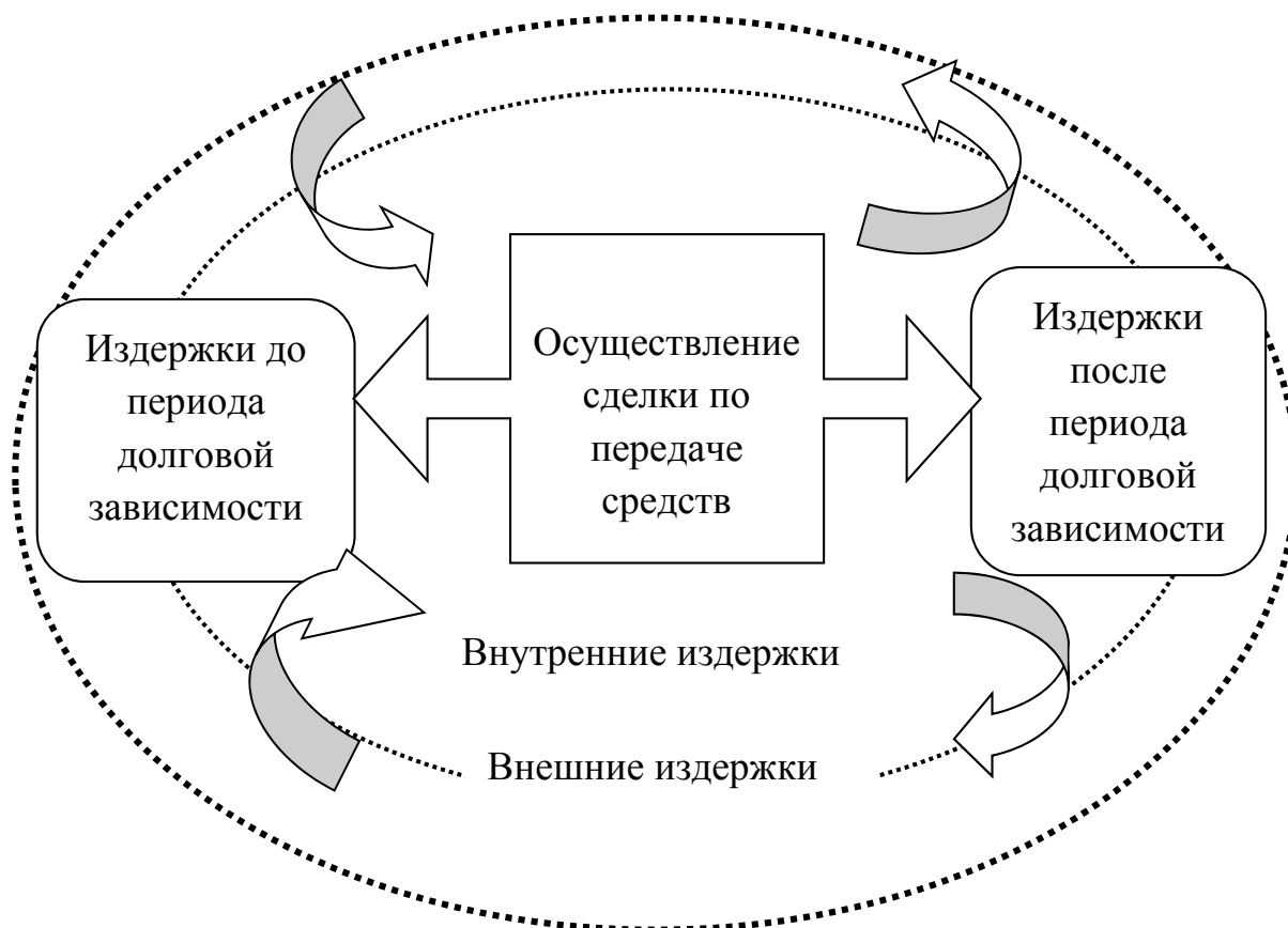
Рисунок 2 – Основные укрупненные группы транзакционных издержек в системе внешнего долгового рынка

В современных условиях в мировом финансово-экономическом пространстве наблюдается возрастание транзакционных издержек в связи с выходом экономической активности на глобальный уровень, невозможность их минимизировать в связи с формированием единых критериев взаимодействия на международном уровне.