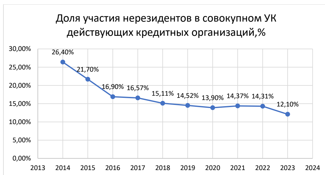
Рисунок 4 – Доля участия нерезидентов в совокупном уставном капитале действующих кредитных организаций, %

На рисунке 4 заметна тенденция к уменьшению доли иностранцев в капитале банков России. По состоянию на 01.01.2023 г. доля иностранного капитала в совокупном уставном капитале КО снизилась на 2,21% и составила 12,10%.