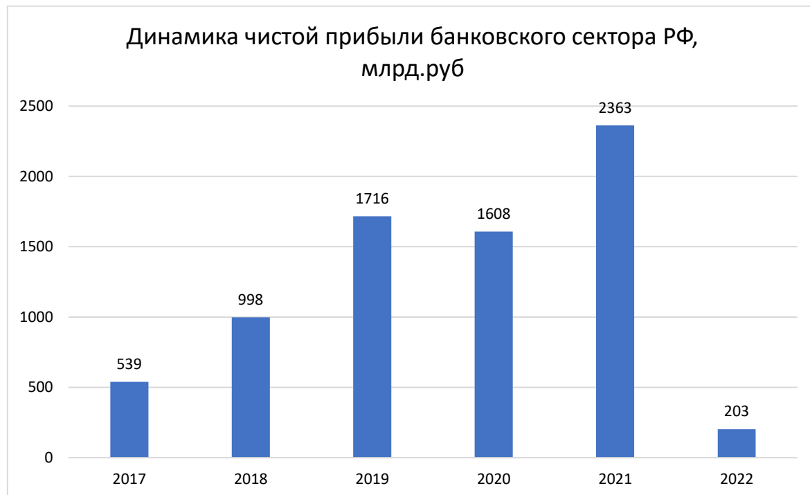
Рисунок 5 – Динамика чистой прибыли банковского сектора РФ, млрд руб.

Чистая прибыль банков, находящихся под контролем нерезидентов, в 2022 году достигла 211,5 млрд рублей, что составляет 104% от общей прибыли всего банковского сектора (203 млрд рублей). Годом ранее банки с участием нерезидентов получили прибыль в размере 262,3 млрд рублей (рис. 5).