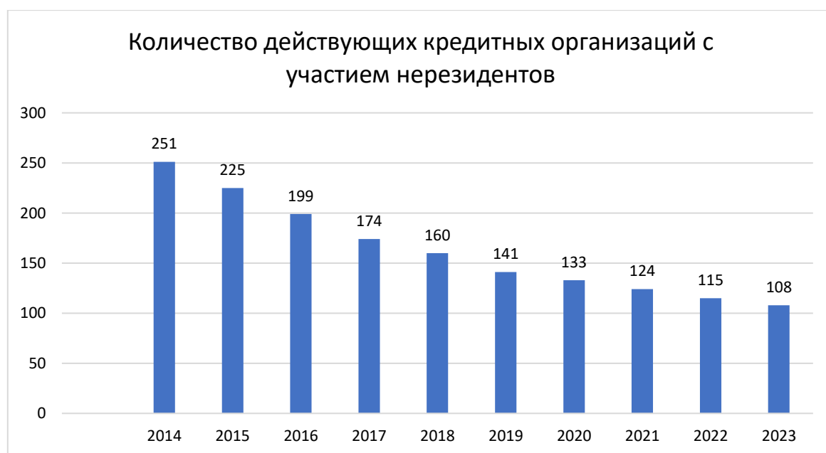
Рисунок 1 – Количество действующих кредитных организаций с участием нерезидентов, единиц

В начале 2023 года в России была зарегистрирована 361 кредитная организация, обладающая лицензией на проведение банковской деятельности. Из которых 108 было с иностранным участием (рис.1) [3]. Это составляет 29,9% от общего числа зарегистрированных КО. В течение 2022 года количество кредитных организаций с участием нерезидентов сократилось на 7. Это произошло из-за реорганизации 1 банка, перехода акционеров-нерезидентов 2 банков в юрисдикцию РФ и продаже акций 4 банков резидентам страны.