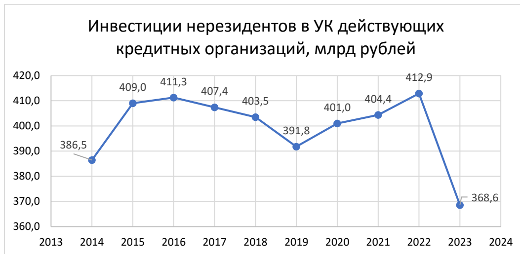
Рисунок 3 – Инвестиции нерезидентов в уставные капиталы действующих кредитных организаций, млрд рублей

На рисунке 3 мы видим, что на фоне введенных санкций, объем иностранных инвестиций в уставной капитал действующих КО в России за 2022 год сократились на 10,7% или 44,292 млрд руб. Пик снижения пришелся на 2023 год, инвестиции составили 368,619 млрд руб. [5].