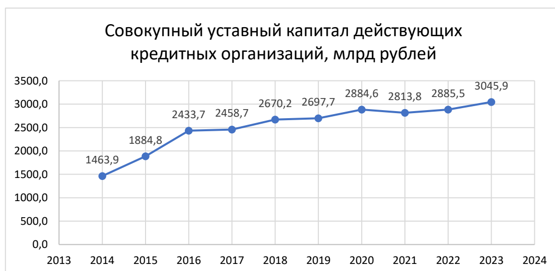
Рисунок 2 – Совокупный уставный капитал действующих кредитных организаций, млрд рублей

В 2022 году размер совокупного уставного капитала КО вырос на 5,6% или на 160,4 млрд рублей (рис.2). Увеличение преимущественно связано с проведением дополнительной эмиссии и другими вложениями в капитал. На начало 2023 года совокупный УК достиг отметки в 3 045,9 млрд рублей.