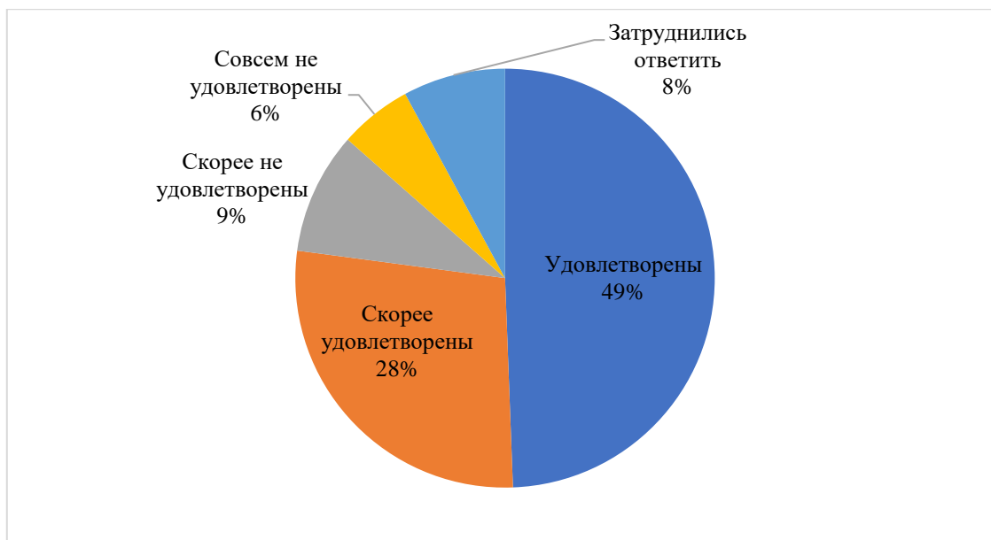
Рисунок 1 – Результаты опроса на вопрос удовлетворенностью работой среди трудоспособных инвалидов, в % [3]

Определяя причины того, почему трудоспособные инвалиды не удовлетворены свою работою, были получены следующие результаты опроса, продемонстрированные на графике (рис. 2).