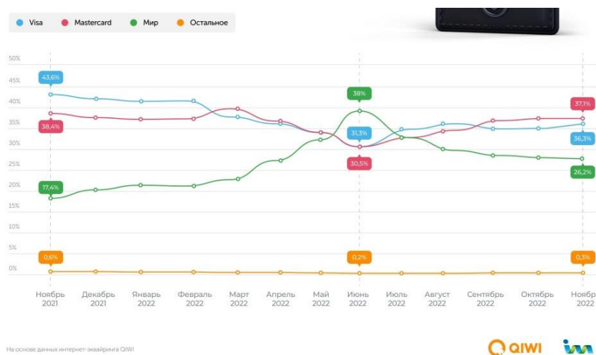
Рисунок 2 – Статистика использования карт МИР в 2022 году

Рисунок 2 отражает увеличение использование карт с платежной системой МИР почти вдвое после начала специальной военной операции.