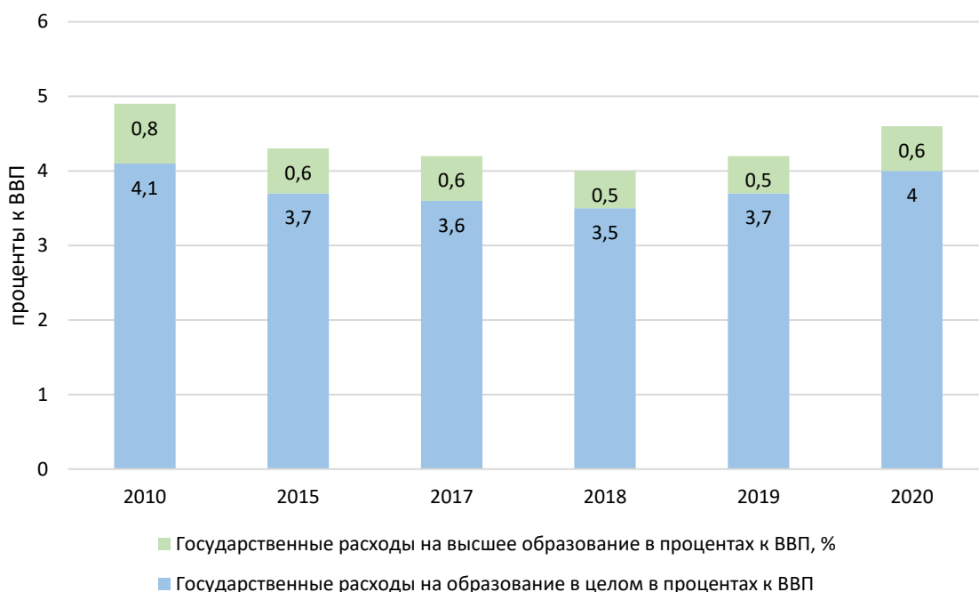
Рисунок 1 – Доля государственных расходов на высшее образование и на образование в целом в процентах к ВВП