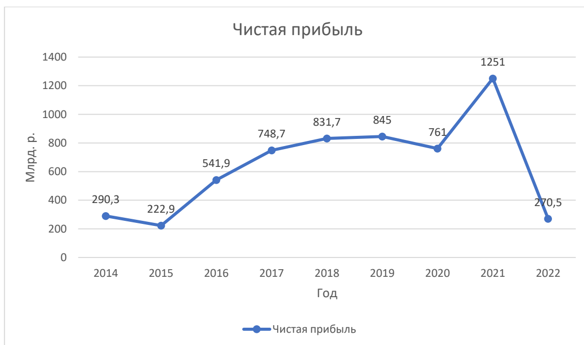
Рисунок 3 – Чистая прибыль ПАО Сбербанк, млрд. руб.