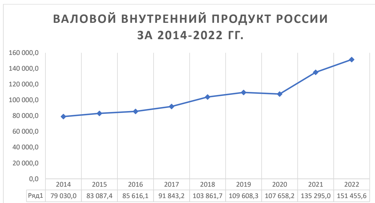
Рисунок 1 – Показатели ВВП России за 2014–2022 гг., в млрд руб.

На экономику России санкции оказывают влияние, приведем сравнительную характеристику основных макроэкономических показателей. Одним из основных макроэкономических показателей является валовой внутренний продукт (далее ВВП), который оценивает развитие экономики государства. По данным Федеральной государственной службы статистики (далее Росстат), ВВП Российской Федерации имеет положительную динамику, показывая значительный рост до пандемии коронавируса (рис. 1). Но реальный темп роста составил -2,1%, что говорит о снижении ВВП в 2022 году на 2,1%. На это и повлияли экспортные отношения.