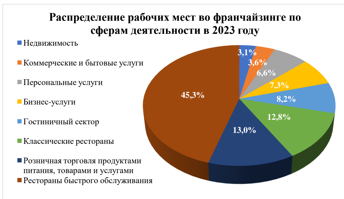
Рисунок 1 – Структура рабочих мест франчайзинга по сферам деятельности

По оценкам, в 2023 году в секторе быстрого питания будет занято 45,3% (рис. 1) всех франчайзинговых работников.