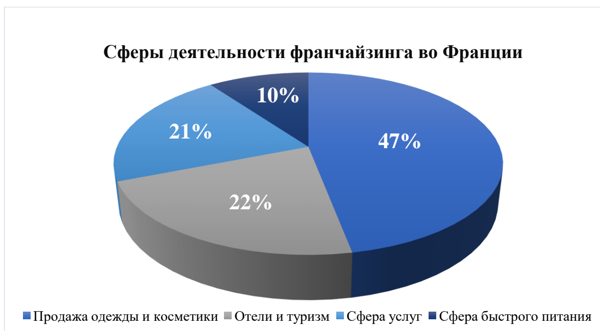
Рисунок 2 – Структура франчайзинга во Франции

Франчайзинг во Франции представлен в самых разных секторах (Рис.2), включая продажу одежды и косметики (47%), отели и туризм (22%), сферу услуг (21%), сфера быстрого питания (10%).