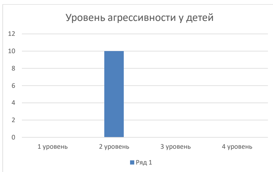
Рисунок 3 – Уровень агрессивного поведения у детей дошкольного возраста

3. Методика А. Романова регистрации проявлений агрессии «Ребенок глазами взрослого». С помощью данной методики мы смогли определить уровень выраженности агрессивного поведения у детей дошкольного возраста. Результат представлен на рисунке 3.