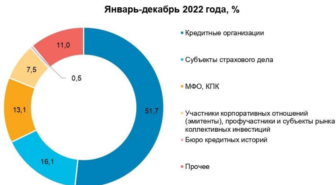
Рисунок 2 – Сводная информация по количеству жалоб от потребителей финансовых услуг [3].

Стоит отметить, что, сравнивая качество услуг банковских учреждений и микрофинансовых организаций, важно учитывать обратную связь от потребителей (рис. 2).