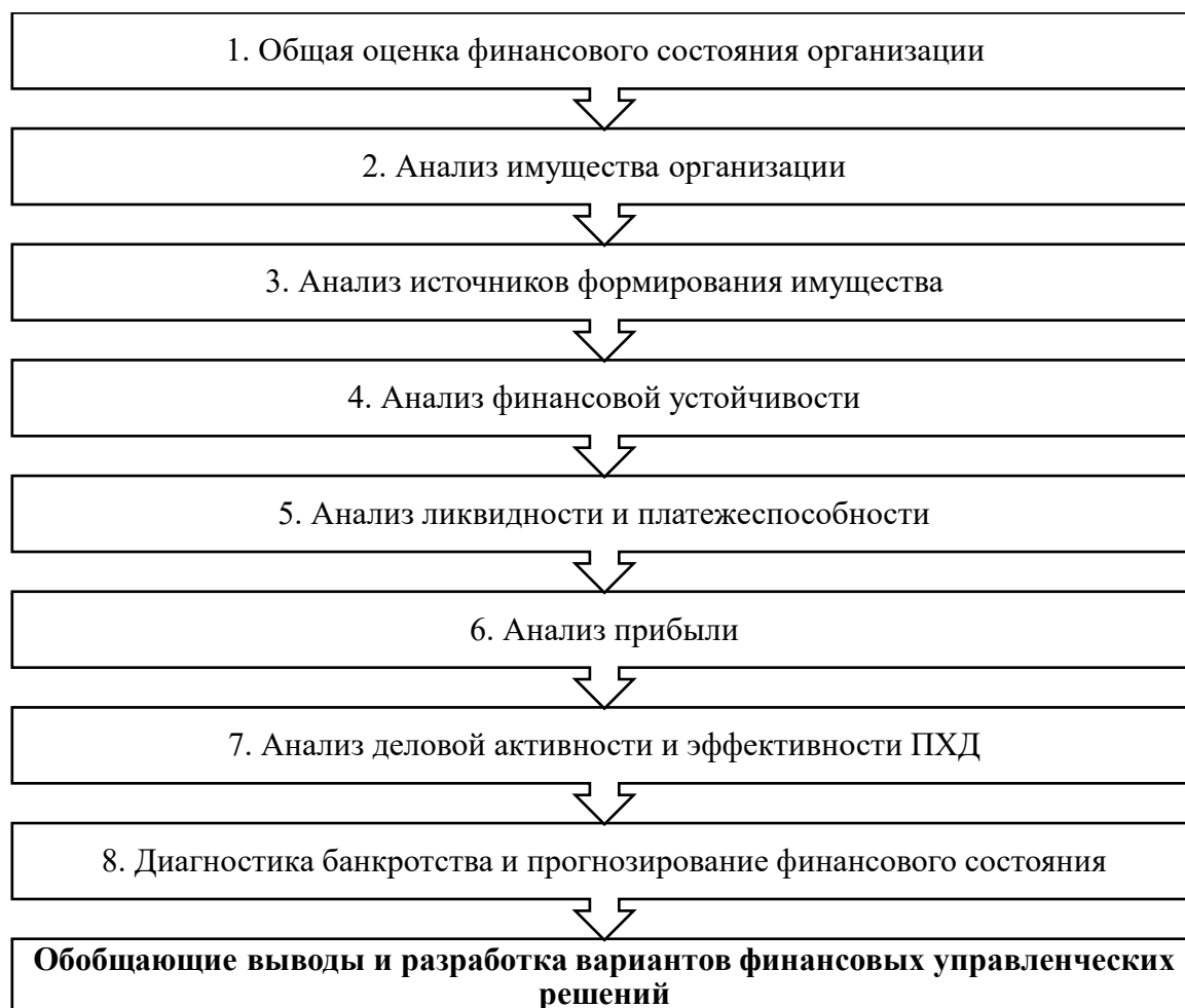
Рисунок 2 – Блок-схема анализа финансового состояния субъекта хозяйствования [5, с. 32]

просроченной в случае наличия финансовых проблем у контрагентов. Анализ необходимо проводить в определенном порядке (рис. 2).