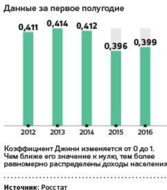
Рисунок 3 – Коэффициент Джинни (динамика за 5 лет)

Введение прогрессивной шкалы налогообложения может помочь существенно улучшить данный показатель, а также увеличить удельную долю среднего класса в России.