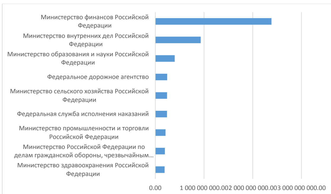
Рисунок 3 – Бюджетные ассигнования по госпрограммам в разрезе ГРБС, (млрд руб.) [5]

Как отмечалось выше, финансовое обеспечение реализации государственных программ происходит за счет бюджетных ассигнований, которые выделяются из различных министерств и федеральных служб. На рисунке 3 представлена структура финансовых средств на реализацию государственных программ.