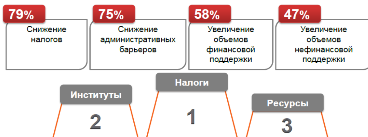
Рисунок 1 – Рейтинг наиболее острых проблем сектора МСП

Сотрудниками МСП Банка в марте 2013 года был подготовлен доклад на тему «Малый и средний бизнес в России: системные проблемы развития и их решения» в рамках которого составлялся рейтинг наиболее острых моментов для компаний сектора МСП [3].